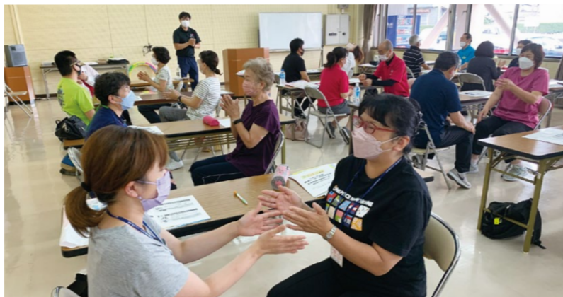
社内研修で使えるレクリエーションゲーム

「元気をつくる健康エクササイズ」。最終日は、障がい者レク実技セミナー「身近なものを遊んで遊べるレクリエーション」を行いました。 また、全日程を通して「ふらば～るバレー講習」を行い、楽しい遊び方の伝授と用具の進呈を行いました。受講した皆さんは、これからミナレク運動推進リーダーとして各所でレクリエーションを広め、多くの方々に楽しさを伝えていただきます。