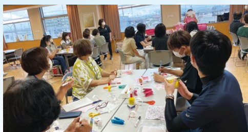
つくってあそべるクラフト講習