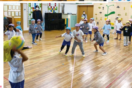
市内保育園で巡回教室を実施