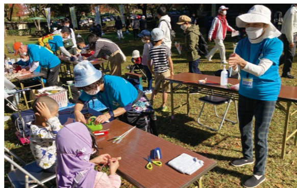
つくってその場であそべるクラフト体験は大人気!

11月5日(土)、岐阜県百年公園北口芝生広場にて開催。準備運動としてミナモ体操を参加者全員で行い、元気づけに開会しました。開催中には尾関健治関市長にもご激励に駆けつけていただきました。「スカットボール」や「クラフト」などのレク体験コーナーに、岐阜県、県警のPRブースをあわせて8の体験ブースを設置。公園内をまわる「ウォークラリー」も開催し、1,500名の来場がありました。