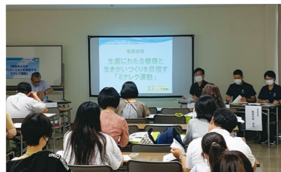
全国大会で発表した「ミナレク運動」の取組み

令和4年9月18日（日）、兵庫県で開催された「第76回全国レクリエーション大会2022ひょうご」研究フォーラムにて、「県民みんながレクリエーションを実践するミナレク運動」が岐阜県とともに取り組んできた成果と今後の展開についてと題し、ミナレク運動の取組みを全国に発信しました。