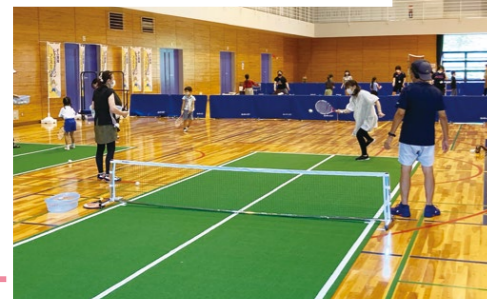
様々なレクが体験できます