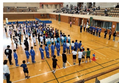
第1回ひだのこドッジボール交流大会