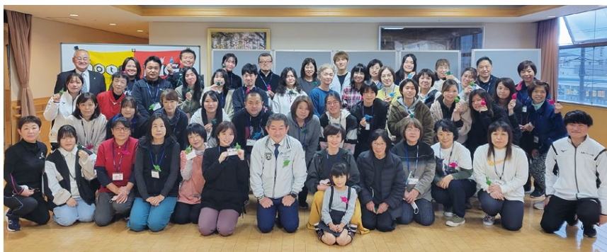
受講者とスタッフの集合写真