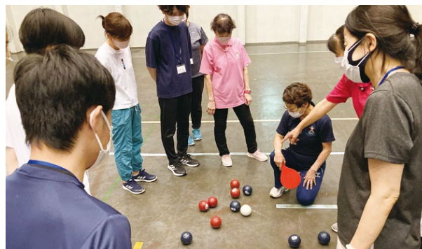
ボッチャの実技体験

講習会では、初対面の人同士の緊張をほぐし、コミュニケーションの取りやすい雰囲気をつくるアイスブレイキングのゲームをはじめ、子ども運動あそびや障がい者レクリエーション、高齢者施設で活用できるレクなどの実技を学びました。さらに、イベントにもスタッフとして参加し、現場での経験も重ねました。今回受講された方は3月の審査会に合格すると「レクリエーション・インストラクター」になります。ミナレク運動の普及に新たな仲間が増えることを期待しています。