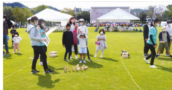
企画した「モルック」コーナーを運営する学生

次の世代のレク活動の担い手となる人材を育成するため、県内の高校生や大学生を対象に、レクの実践方法や指導方法を学ぶ講習会を開催しました。 高校は、レクの基本となるコミュニケーションプログラムの体験学習をはじめ、介護実習で役立つ体操や、幼児教育で活用する運動遊びなどを学習しました。 大学は、イベントを企画・運営しました。大垣女子短期大学では、4月からレクの実技や支援の理論を学び、プログラムを計画。10月8日の「ぎふ清流レクリエーションフェスティバル」において、マンカラとモルックの体験ブースを運営しました。 〈大学〉・大垣女子短期大学 ・岐阜聖徳学園大学 ・岐阜県立揖斐高等学校 ・岐阜県立関有知高等学校 ・岐阜県立海津明誠高等学校