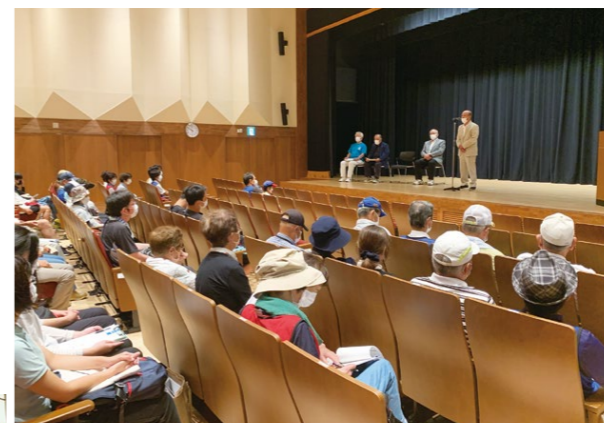
ウォークラリー大会開会式

会(ねりんピック)では、美濃市の観光名所である「うだつの上がる町並み」を中心としたウォークラリー大会の開催が内定しており、これまでコロナで中止となった年を除き、協会設立以降、ほぼ毎年ウォークラリー大会が開催されてきました。ねりんピックに向け、「ウォークラリーの町・美濃市」を全国に発信していきます。