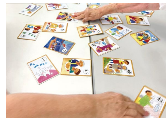
継続的に取り組めるレクリエーションプログラムを提供

県民が楽しみながら健康づくりに励んでもらうため、学校や高齢者施設などへ年間300回以上派遣をしています。運動遊びや、健康体操など、誰でも気軽にレクの楽しさを体感することができるようプログラムを提供しています。 今年度の新たな取組みとして「オーダーメイド派遣」を実施し、団体が継続的に取り組めるレクプログラムの開発や支援を行いました。本事業を利用した岐阜市の高齢者サロンでは、レク用具を活用した認知症予防のレク活動を提供。派遣が終わった後も、レクリエーションを行っていただけようよう支援をしていきます。