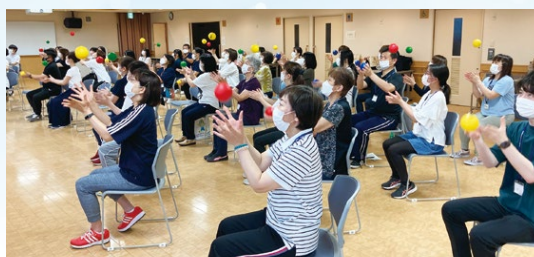
ボールを使った高齢者体操