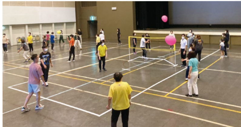
ふらば～るバレー講習

令和4年7月16日（土）～18日（月・祝）の3日間、羽島市民会館にて開催し、県下各地から223名の方にご参加いただきました。初日は、幼児レク実技セミナー「すぐにやりたくなる楽しい運動あそび」と、児童・生徒・学生レク実技セミナー「子どものコミュニケーション力を引き出すレクあそび」。2日目は、就業者レク実技セミナー「社内研修で使えるレクリエーションゲーム」と、高齢者レク実技セミナー