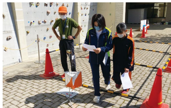
初めて体験するオリエンテーリングにドキドキ

10月2日(日)、飛騨高山ビッグアリーナにて開催。来賓に高殿尚岐阜県議会議員にご臨席いただきました。開会では、高山レク協会による指導でミナモ体操を体験しスタート。「スポーツチャンバラ」や「オリエンテーリング」などのレク体験コーナーに、岐阜県、県警のPRブースをあわせて12の体験ブースを設置。「高山市民スポーツフェスティバル」と同時開催し、1,000名の来場がありました。