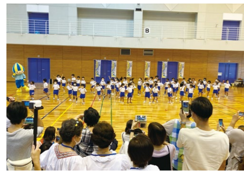
レクフェスの開会式では園児によるミニモダンスを披露