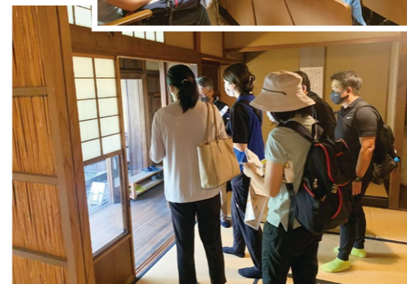
美濃市の観光をまわりながら楽しむ参加者